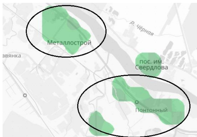
Рисунок 4. Пример выделения кластера с территорией больше территории одного муниципального образования